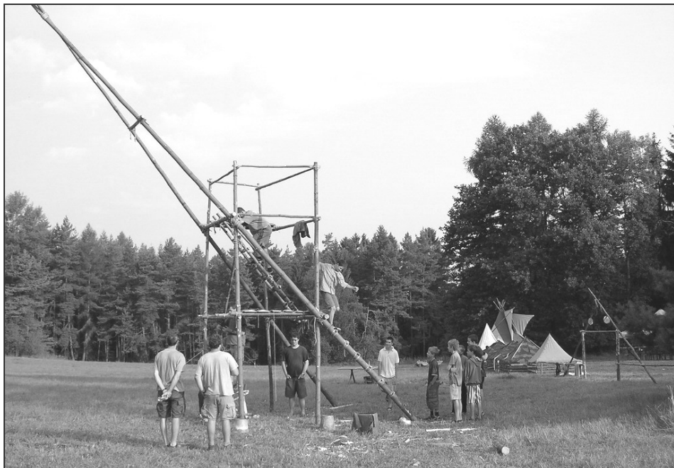
jedna z dalších impozantních staveb ČŠ ☺

Další prázdninové cíle jsou pokořeny (ať už to jsou proběhlé tábory nebo další dlouhodobá předsevzetí na léto) a i v letošním podzimním časopise je přibližují některé fotky a obrázky. Tudiž se ani čtenář nemůže divit, že když čte o zbojnicích ze Sherwoodského lesa, vidí dole „Sherwoodský les,“ jenom to je odněkud úplně jinud. Nebo také fotky z jednoho malého výletu.