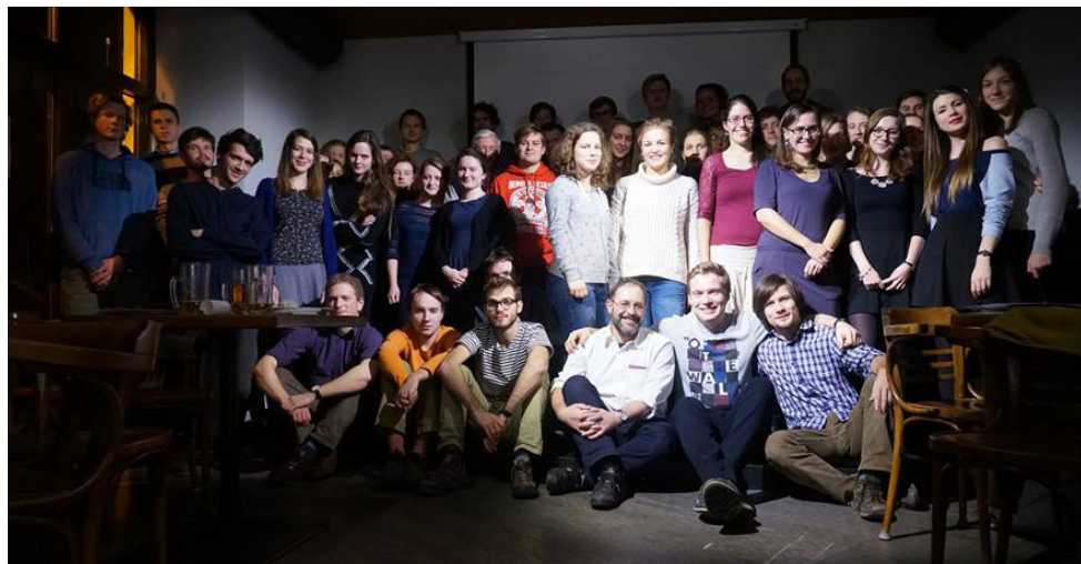
fotografie z vánoční střediskovky, prosinec 2017

Zkrátka pro mě by nebyl Štědrý den bez toho filmu, Štědrým dnem.