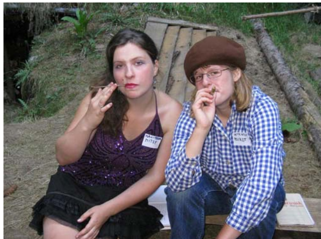
Slečna Mitzi a Hercule Poirot

v polovině programu vyhlásila báječná slečna Mitzi, že se začnou prodávat také pouťová štěstíčka. Ač již někteří byli téměř švorc, štěstíčka šla skutečně na dračku. Avšak každá zábava musí ale jednou skončit, a tak i slečna Mitzi ukončila program a my museli jít spát. Škoda, bylo to fajn!