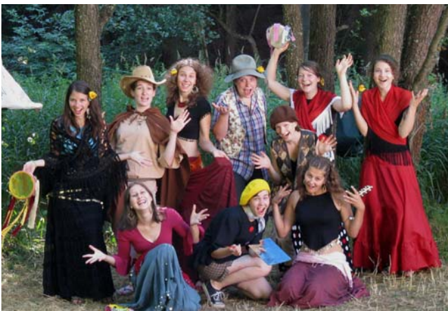
Etapovka Statečných srdcí