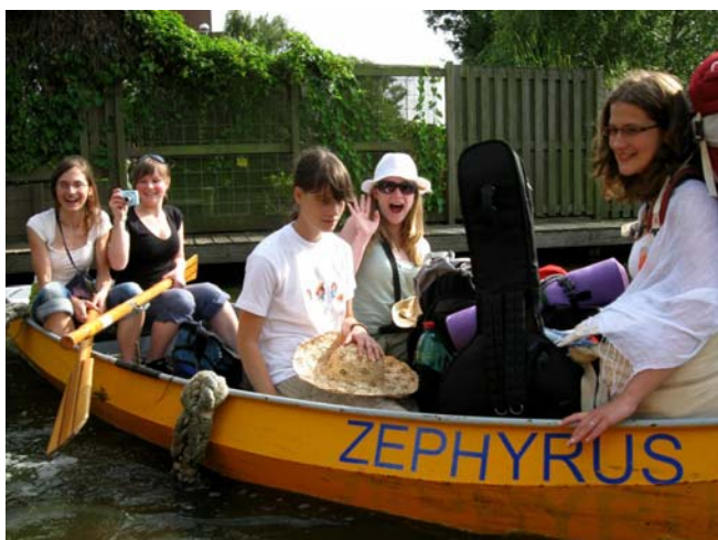
Dobrá nálada panovala po celou dobu pobytu

http://vlicata.rajce.idnes.cz/ (družinková fotogalerie)