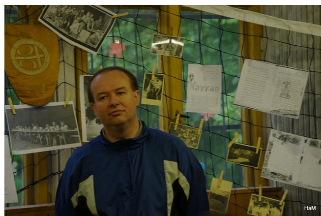
Havel, jeden ze zakládajících redaktorů časopisu Blaník

Byla jsem z celého odpoledne tak unešená, že jsem si od jedné velice sympatické slečny u pultíku koupila 70 blanických nášivek, abych je mohla u nás ve středisku v Brtnici rozdávat. A vůbec toho nelituji; je totiž opravdu na co vzpomínat.