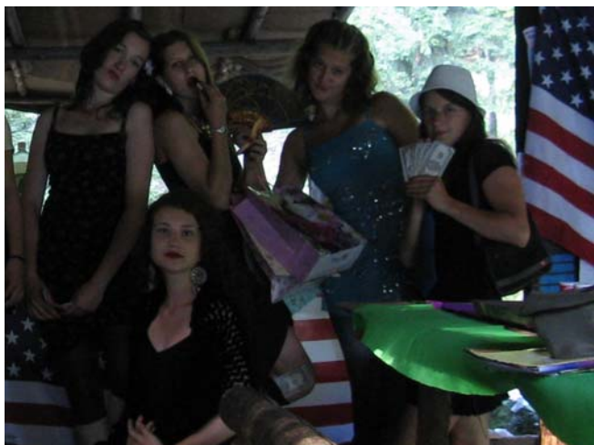
Vsadíte si u nás?

Začalo to celkem nenápadně - děti si vylosovaly postavu, do které se měly stylizovat. A tak se táborové náměstíčko za chvíli hemžilo zajímavými lidičkami jako kapsářka matka Brownová, páter Leoš Smith nebo švihácký tenista Brown jr. Nechyběla modelka, detektiv, tanečnice, bezdomovec ani řádová sestra. Někteří patřili ke dvěma hlavním rodinám Brownů a Smithů.