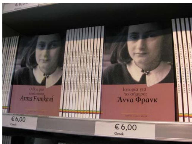
České a řecké vydání Deníku Anny Frankové

Celý pobyt v Holandsku nám zpříjemňovalo (i tak se to dá říct) právě probíhající mistrovství světa ve fotbale, takže jsme se často ocitaly v záplavách fotbalových vlaječek a všude-přítomné oranžové. Co se týče holandské dopravy, tak ta nám zrovna dvakrát nepřála. I když vlastně jak kdy. Na menších nádražích jsme jakožto cizinci neměly šanci sehnat lístky na vlak. Zato jsme se ale párkrát vezly zadarmo nebo za neúplnou cenu (zajímavé bylo porovnávat výši ceny s úspěchem ve fotbalovém utkání