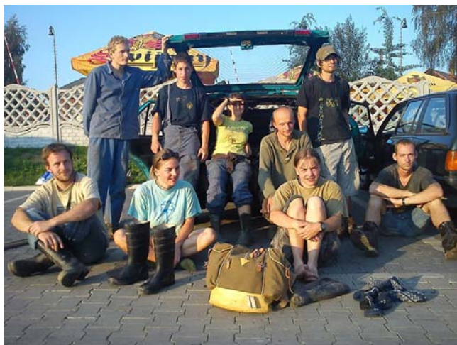
Úderný blanický tým

Tedy, hra spočívala v objevování a především v znovuobnovování Nového světa, který byl rozprášen obrovskou katastrofou.