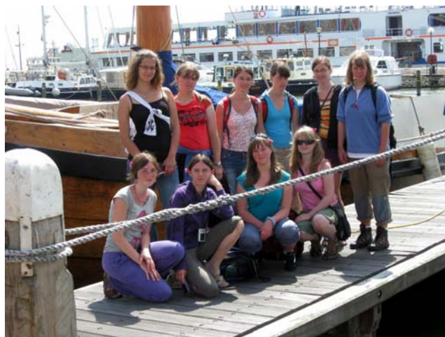
Kompletní sestava cestovatele

Nejely jsme se do Holandska jen tak plácát ke kanálům, ale také obdivovat nějaké historické památky. V Amsterdamu jsme navštívily muzeum Anne Frankové, také třeba květinový trh, dále jsme zavítaly k moři do historického Volendam, i nedalekého Edamu (Eidamu). Potkaly jsme i typické holandské dřeváky a nesmíme zapomenout na holandský sýr, který jsme také ochutnaly. ☺