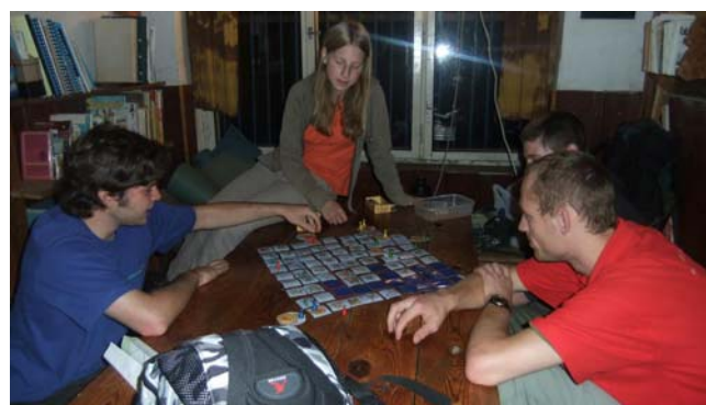
I vedoucí si občas potřebují pohrát...

Vzhledem k tomu, že mezitím dorazilo několik dalších lidí, málem jsme se tam nevešli. Byl nám dán prostor na prodiskutování toho, co nás pálí, ale asi nikoho nic nepálilo. Nakonec byly během odpoledne sepsány asi tři problémy a každý mohl podat návrh na jejich řešení. Mezitím jsme se navzájem představili. Dále jsme v jednotlivých oddílech předváděli téma etapky letošního tábora, popisovali jeho místo a kreslili naši typickou táborovou aktivitu. Ostatní samozřejmě hádali.