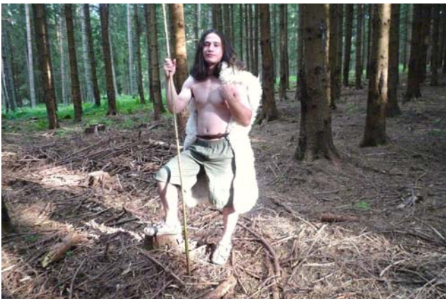
Etapovka Mayů a Utahů