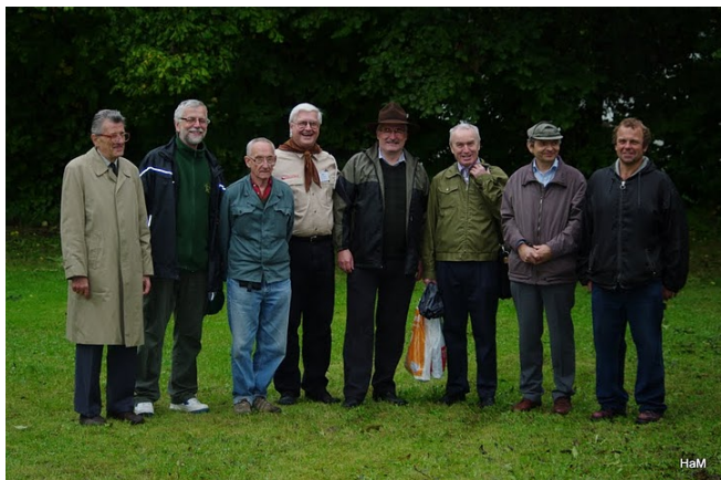
Bývalí členové střediska

Obrovským plusem bylo i delikatesní občerstvení – jsem známá tím, že ráda mlám. Šťavnaté marinované steaky zalahodily mému jazýčku. A mezitím mé slechy zaměstnávaly poutavé přednášky zasvěcených o historii a významu střediska i skautingu v minulém století. Příjemná hudba na závěr byla pro mě dalším milým překvapením, stejně tak jako osobní podání ruky na rozloučenou od samotného vůdce střediska, mimochodem opravdu pohledného mladíka.