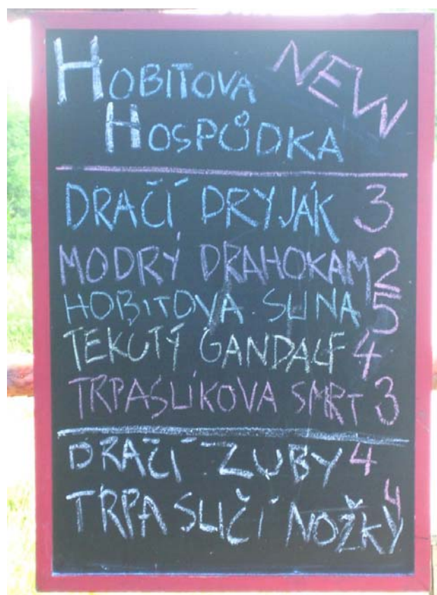
Etapová hospůdka Scarabea