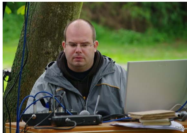
Skvělý zvukař Brouk

Obrovským plusem bylo i delikatesní občerstvení – jsem známá tím, že ráda mlám. Šťavnaté marinované steaky zalahodily mému jazýčku. A mezitím mé slechy zaměstnávaly poutavé přednášky zasvěcených o historii a významu střediska i skautingu v minulém století. Příjemná hudba na závěr byla pro mě dalším milým překvapením, stejně tak jako osobní podání ruky na rozloučenou od samotného vůdce střediska, mimochodem opravdu pohledného mladíka.