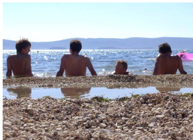
Trochu lepší rybník

Poslední týden letošních prázdnin se deset vedoucích z Protěže (včetně Kosti z Keyi) rozhodlo, že je na čase odpočinout si od českých luhů a hájů a strávit společně několik dní relaxem a válením se u moře. Jako správní Češi jsme vyrazili do Chorvatska a jako správní skauti jsme jeli vlakem, ti nejdrsnější z nás dokonce stopem. Vyrazili jsme tzv. „na blint“, což znamenalo, že jsme měli volnou ruku ve výběru místa i ubytování.